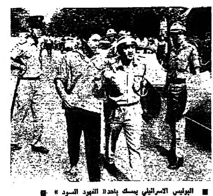
البوليس الاسراييلي يسك باحد «الفهود السود»

وتكرسوا «الفهود السود» شارلي بيتون انه بموجب الاتفاقيات الرسمية، لا يملك اليهود الشرقيين سوى ٩ بالمائة فقط من الحصص الرئيسية و١٥ بالمائة من مقاعد الجامعات.